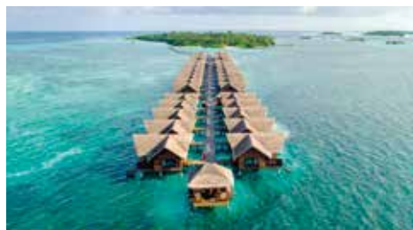
Hotel Adaaran Select Hudhuranfushi****

Das Hotel Adaaran Select Hudhuranfushi**** bietet eine Rezeption, Restaurant, Bars, Süßwasserpool, SPA-Bereich und ein Sport-, Unterhaltungsprogramm (teilweise gegen Gebühr). Die Beach Villas sind mit offenem Bad/Badewanne, Außendusche, Föhn, Klimaanlage, Telefon, Sat.-TV, Minibar (gegen Gebühr), Safe und möblierter Holzterrasse ausgestattet. Die Wasserbungalows (Ocean Villas) sind buchbar und verfügen zudem über Meerblick. Der Transfer zum Hotel erfolgt per Schnellboot. Verpflegungen All Inklusive: Mahlzeiten in Buffetform, täglich Snacks, Tischwein zum Mittag- und Abendessen und lokale alkoholfreie und alkoholische Getränke zwischen 10 und 24 Uhr.